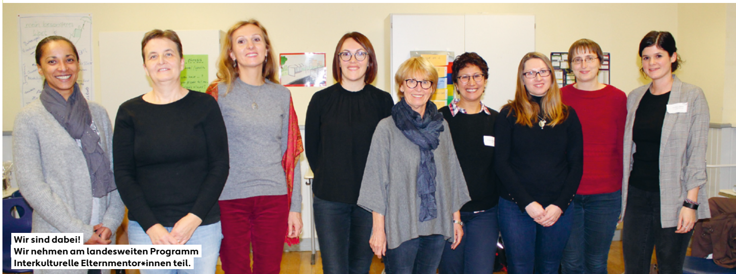
Wir sind dabei! Wir nehmen am landesweiten Programm Interkulturelle Elternmentor*innen teil.