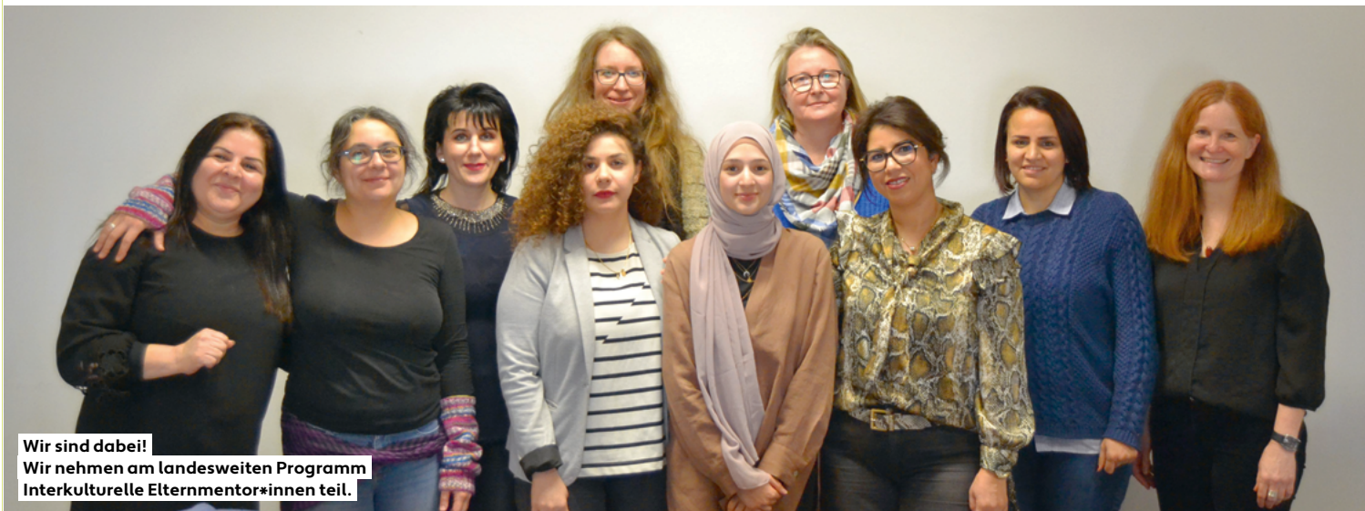
Wir sind dabei! Wir nehmen am landesweiten Programm Interkulturelle Elternmentor*innen teil.