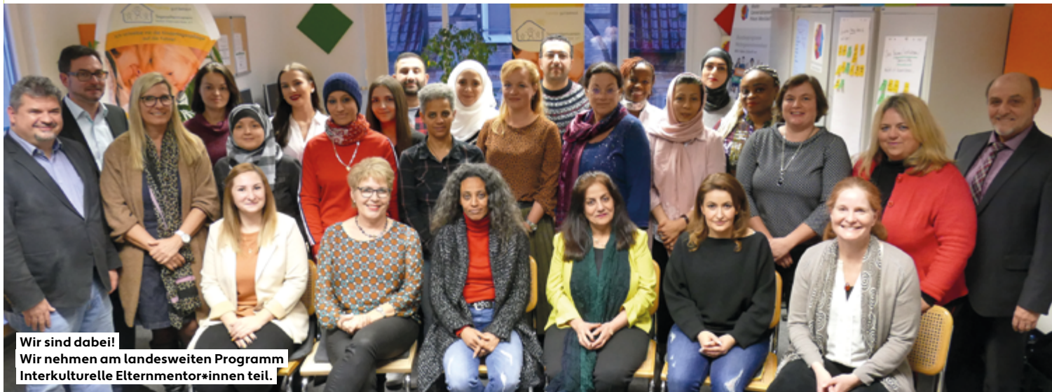
Wir sind dabei! Wir nehmen am landesweiten Programm Interkulturelle Elternmentor*innen teil.