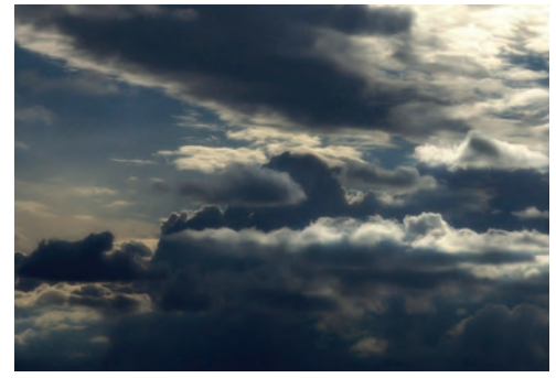
Abb. 1: Bildimpulse Wetterlage