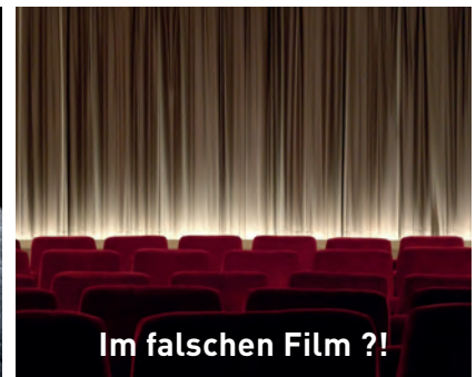
Abb. 2: Bildimpulse Digitalisierung

Wenn ich an Digitalisierung denke, dann ... oder Wie geht es Ihnen mit diesem Online-Elternabend? (Mehrbenutzermodus oder Bild im Chat nennen).