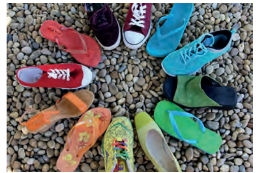
Abb. 3: Beispielbilder für eine Rückmeldung zur Atmosphäre in der Klasse aus Sicht der Lehrkraft

Abhängig von der Tagesordnung können weitere Informationen in Schriftform übermittelt werden. Sie können beispielsweise Schulausflüge, Schullandheimaufenthalte, die Stundentafel und differenziert angebotene Unterrichtsveranstaltungen oder die Schülermitverantwortung der Klasse betreffen.