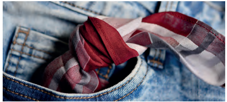
Abb. 4: Beispielbilder für herausfordernde Situationen in der Klasse

Diese Fotos können Anlass zum Gespräch über die Atmosphäre in einer Klasse sein. Sie können die Stimmung (Wetterlage) in der Klasse oder eventuelle Konflikte (Knoten) symbolisieren. Aus der Perspektive der Lehrkraft könnte das Gespräch wie folgt beginnen: „Gerade geht es hier sehr turbulent zu und wir wollen jetzt nicht abwarten, bis sich die Wetterlage ändert, sondern überlegen, was der Klasse helfen kann. Die Fachleh-